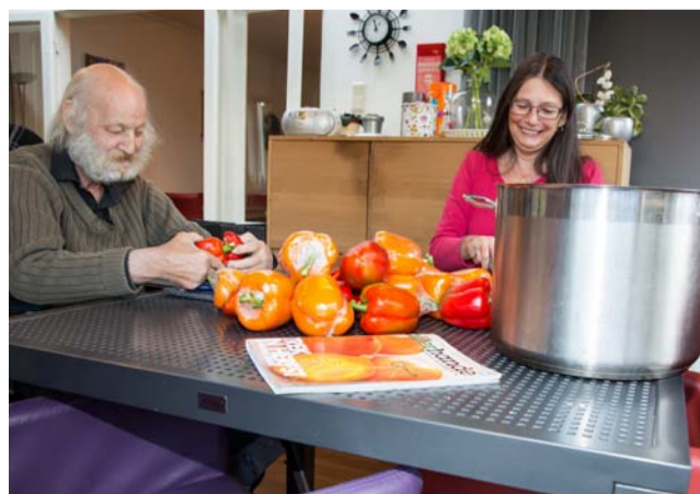
Begeleid Wonen in De Wending (Naarden) en aan de Elise Dammershof in Bussum.

De methodiek die de RIBW G&V hanteert, het 'Systematisch Rehabilitatiegericht Handelen' (SRH), sluit aan op de genoemde uitgangspunten. Alle medewerkers zijn hierin geschoold. Ook zijn er scholingsmogelijkheden in motiverende gespreksvoering en het vinden van aansluiting bij de leefstijl van cliënten. Youké en de Jeugd- en Gezinsbeschermers werken uiteraard ook met methodieken. Hoe verhoudt het één zich tot het ander en hoe kunnen we gebruik maken van elkaars expertise?